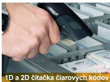
1D a 2D čítačka čiarových kódov