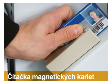
Čítačka magnetických kariet