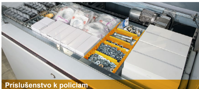
Príslušenstvo k policiam

V policiach možno vytvoriť umiestnením priečok a deličov bunky, ktoré Vám umožnia skladovať na rovnakej polici materiál a tovar s rôznymi rozmermi. Jednoduchým preskladaním priečok a deličov potom možno rozloženie police flexibilne meniť.