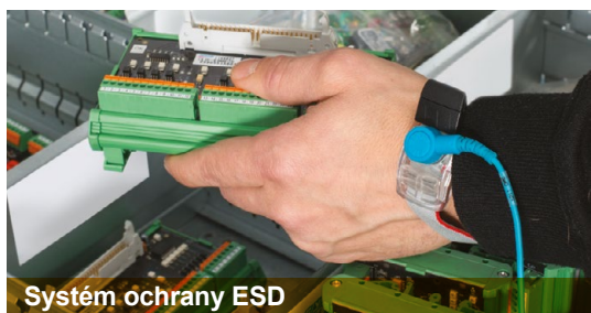
Systém ochrany ESD

MOŽNOSTI, KTORÉ ZVÝŠUJÚ PRODUKTIVITU Čítačky čiarových kódov 1D / 2D dokážu produkt rýchlo naskenovať a vyhnúť sa akýmkoľvek manuálnym kontrolám. Integrovaná funkcia Put to Light zvyšuje počet riadkov objednávok spracovaných súčasne alebo spracováva viac objednávok súčasne. Systémy ochrany elektrostatickým výbojom (ESD) chránia citlivé položky.