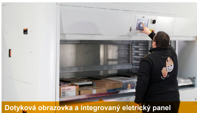
Dotyková obrazovka a integrovaný elektrický panel