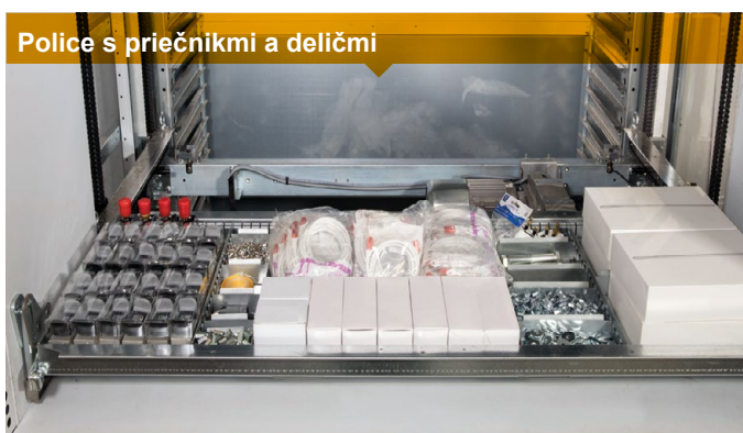
Police s priečnikmi a deličmi