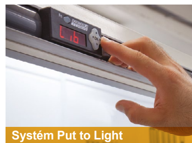
Systém Put to Light