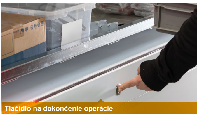
Tlačidlo na dokončenie operácie