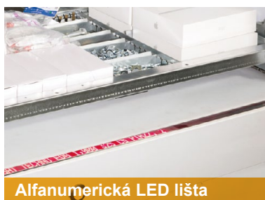
Alfanumerická LED lišta